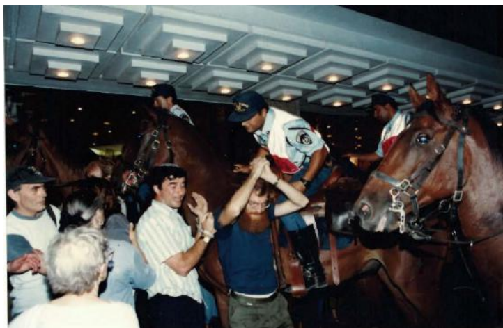
מול מלון המלכים (כיכר פריז): פרשי המשטרה פלשו לחצרות הבתים

פוטנציאלי נעצר מיד. העובדה שכמה אלפים הצליחו בכל זאת להגיע לכיכר הייתה מפתיעה כשלעצמה (בשיחה פרטית עם שוטר בכיר כשנה לאחר האירוע, תיאר הלה בפניי בצבעים ססגוניים את הפחד מהבלתי נודע שאחז במשטרה לנוכח התופעה החדשה הזאת בנוף המחאה הישראלי, ואת התגובה ההיסטרית לכל אירוע הקשור בזו ארצנו). כארבע שורות של שוטרים צמודים זה לזה חצצו בין המדרכות לכביש ומנעו כל אפשרות של ירידה לכביש. מצאתי את עצמי בין כמה מאות מפגינים על המדרכה שנלחצו בין חומת השוטרים לבין קיר מלון המלכים. הציבור נראה כעדר אובד עצות. לקחתי פיקוד וצעקתי לכולם להסתכל אלי ולנהוג כמותי. הרמתי את ידיי, שהיו קשורות במופגן, וקראתי לכולם לעשות כמותי. כשראיתי שהציבור יוצא מהבלבול ומתחיל לתפקד בצורה אחידה, הסתובבתי כשפניי אל השוטרים והתחלתי לצעוד לכיוון הכביש. הציבור מאחוריי עשה כמותי, אבל לא היה לנו שום סיכוי. מספר השוטרים היה גדול בהרבה ממספר המפגינים, ואנו נהדפנו מיד בחזרה. עוד כמה ניסיונות, ואני מורם אל-על על ידי כמה שוטרים ומובל אחר כבוד לניידת המשטרה.