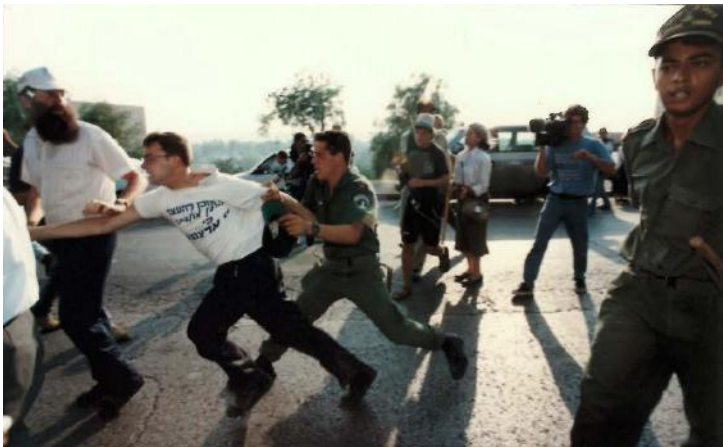
הכתובת על חולצת הצעיר: מוכן להיעצר למען מולדתי כי זו ארצנו

ההפגנה בכיכר פריז הייתה האחרונה בסדרת הפעולות הגדולות של זו ארצנו. ניצני המרי האזרחי נגדעו באלימות רבה, ואנו מצאנו את עצמנו במצב חדש. התקשורת, שבתחילה גילתה התעניינות מקצועית מסוימת בתופעה חדשה בנוף הישראלי, יישרה קו במהירות עם הקו הרביניסטי והכפישה אותנו כאלימים. רוב הציבור אהד אותנו מאוד, אך היה ברור לנו שפעולות גדולות לא יצלחו. ניסינו בכל זאת למצוא דרך להפעיל את ההמונים במרי אזרחי מבינם, בלי לחשוף אותם לידם האלימה של זרועות השלטון.