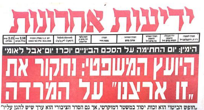
המרדה: כותרת ראשית ב'ידיעות אחרונות', 29.8.1995

ישראל, ואת האפשרות למרי אזרחי. ישראל של רבין לא הייתה דמוקרטיה אמיתית ולכן מרי אזרחי לא היה אפשרי בה. חשבנו שידיים קשורות אל-על מול מצלמות התקשורת ימנעו אלימות פיזית ויאפשרו לנו להניע בכל זאת את גלגלי המרי האזרחי הפסיבי הבלתי אלים. טעינו, ובגדול.