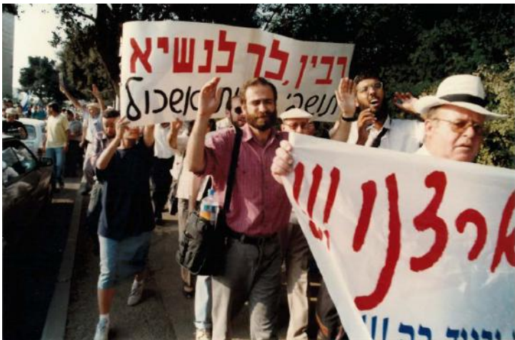
"רבין לך לנשיא" – אוגוסט-ספטמבר 1995

האחרונה, התפזרו האנשים וחזרו לביתם. ירושלים כוסתה סיסמאות "רבין – לך לנשיא." שילוב מוצלח של פעילות יתר משטרתית ומזל תקשורת הפכו את מה שנראה תחילה כישלון חרוץ לפעולת מחאה מוצלחת ביותר. הפעולה דווחה בהרחבה, המסוק שלי הפך לגימיק של היום, והתחושה הכללית הייתה 2:0 לטובת זו ארצנו. אך ה'ניצחון' הזה סימן למעשה את העתיד להתרחש בהמשך.