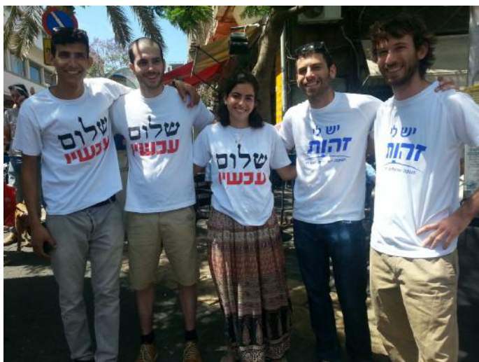
פעילי זהות ושלום עכשיו

התיישבנו בפינת הקפה שבירכתי המליאה. "תגיד לי, שאל, "ארץ ישראל שאתה מדבר עליה כל הזמן, איפה הגבולות שלה?" "ברווה שבין הנילוס והפרת, "עניתי. בר שיחי נרתע לרגע ואז הוסיף ושאל, "מי אמר?" "אלוהים, "עניתי והצבעתי על תקרת הכנסת.