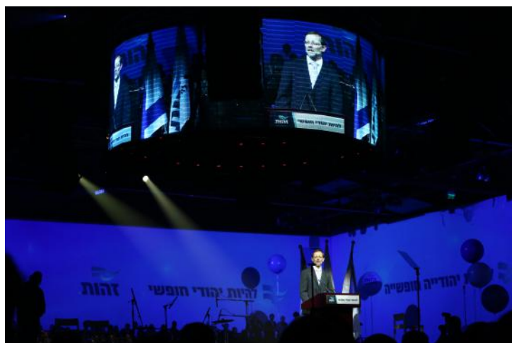
כנס זהות בהאנגר 11

המכות שניחתו עלינו בתחילת הדרך היו צורבות. רוב המתפקדים שפקדנו סירבו לעזוב את הליכוד לטובת המפלגה החדשה. העיתונות המגזרית, זו שבתקופת זו ארצנו ראתה בי סוג של 'נסיך' המגזר, תקפה אותי עכשיו בכל דרך. רבים מהתורמים הקבועים שליוו אותנו לאורך השנים התייאשו וביטלו את הוראות הקבע שלהם.