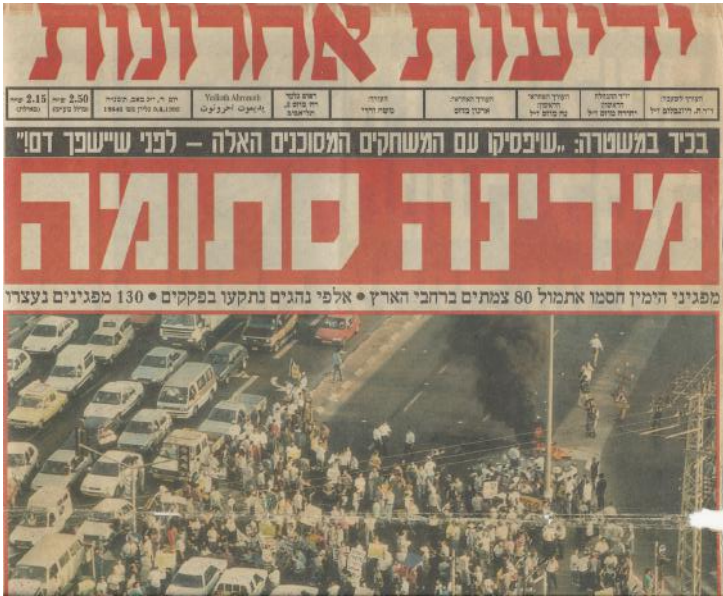
”מדינה סתומה”: כותרת ראשית בידיעות אחרונות, 9.8.1995